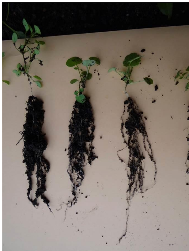
Racines de Véronique

Nous en venons maintenant à la question de savoir comment les plantes assimilent les éléments solubles, et il se trouve que nous devons nous référer à l'humus colloïdal dont nous avons déjà parlé.