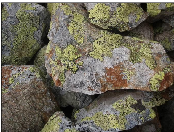
Lichens préparant l'arrivée des mousses

la roche entière se brise en deux. Mais principalement, la partie extérieure devient fragile et des fissures apparaissent, dans lesquelles des lichens et des mousses ont la possibilité de pouvoir s'installer.