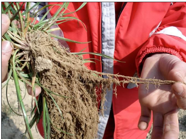
Travail remarquable des racines de graminées dans l'engrais vert

Une prairie peut pousser de cette manière, et cela a bien sûr donné une grande fierté aux scientifiques conventionnels. Mais, le fait est, que le processus naturel que j'ai décrit, partant de la roche et des mousses, avec le développement d'une structure organique et la mise à disposition des éléments aux plantes est un processus très lent.