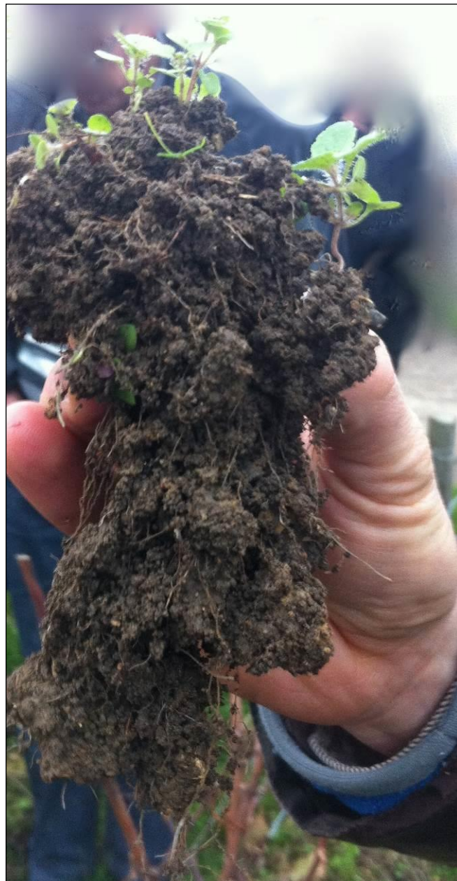
Racines de plantules

encore 40 kg de poudre de sang et d'os par hectare. Le superphosphate rend le phosphate disponible pour le petit déjeuner, le dîner et le souper, puis il n'y en a plus (c'est très souvent le cas avec les engrais artificiels pris dans leur ensemble). Puis, le phosphate naturel prend le relais et apporte un repas pour l'année qui suit. Lorsque nous aurons besoin d'apporter du phosphate naturel, nous n'aurons alors plus besoin d'ajouter de phosphate soluble. Le cycle a commencé.