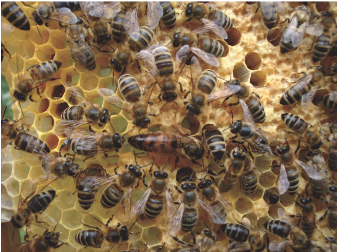
Figure 7 : à la saison du couvain, la reine pond jusqu'à 2 000 œufs par jour ; ses filles la nourrissent de façon intensive.