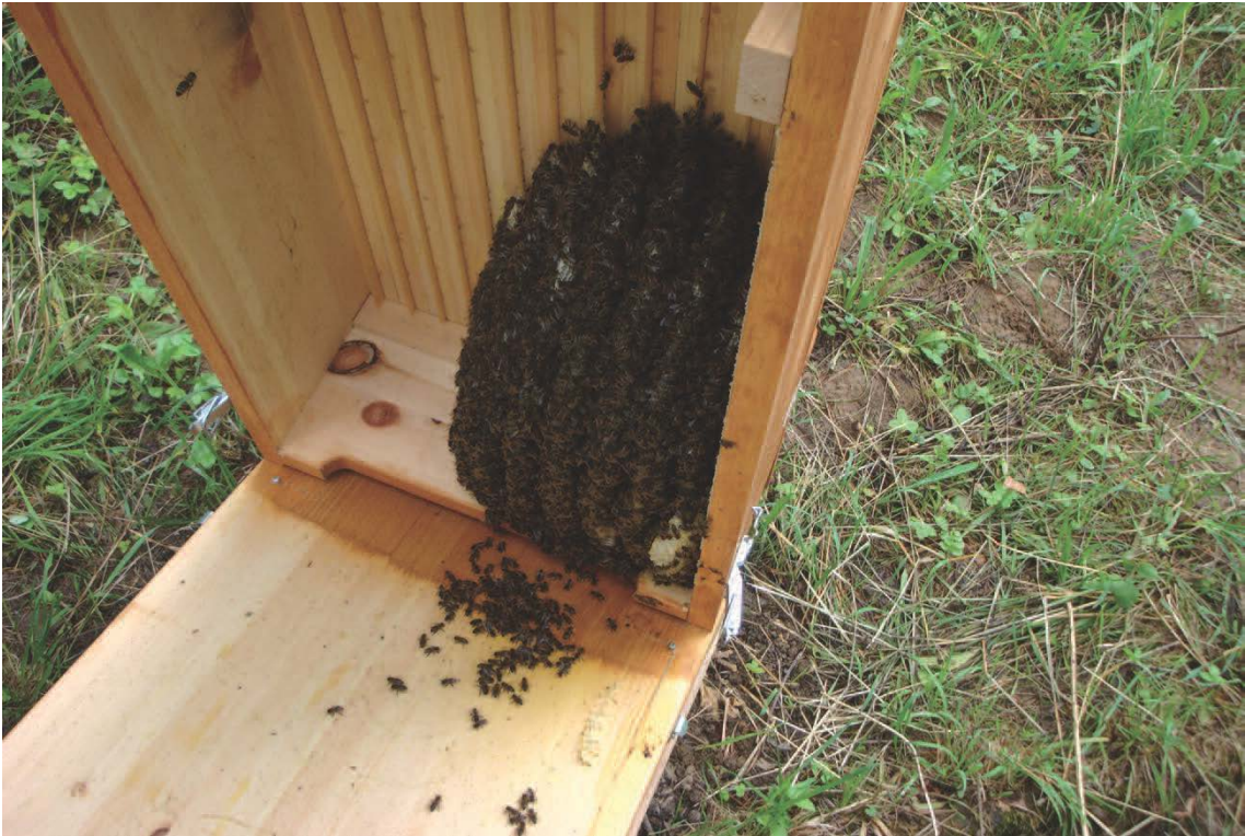
Figure 5 : la colonie s'installe sous forme de demi-sphère sous le plafond de la caisse et commence aussitôt à construire plusieurs rayons proportionnels à sa taille.