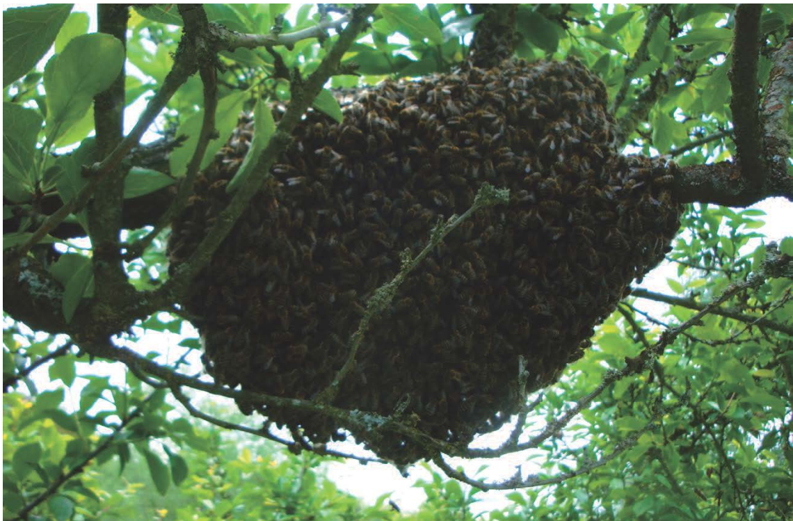
Figure 3 : peu de temps après, l'essaim se fixe en grappe autour d'une branche