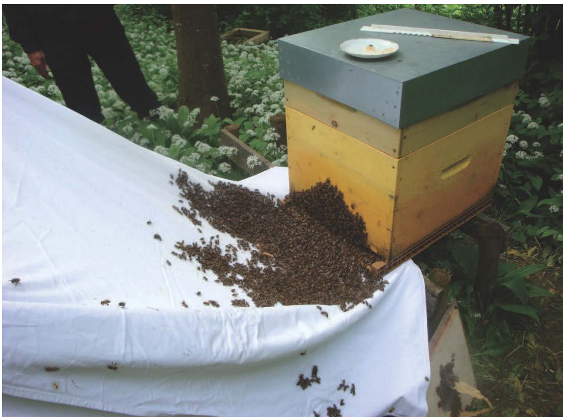
Figure 4 : entrée d'un essaim dans son nouveau logis