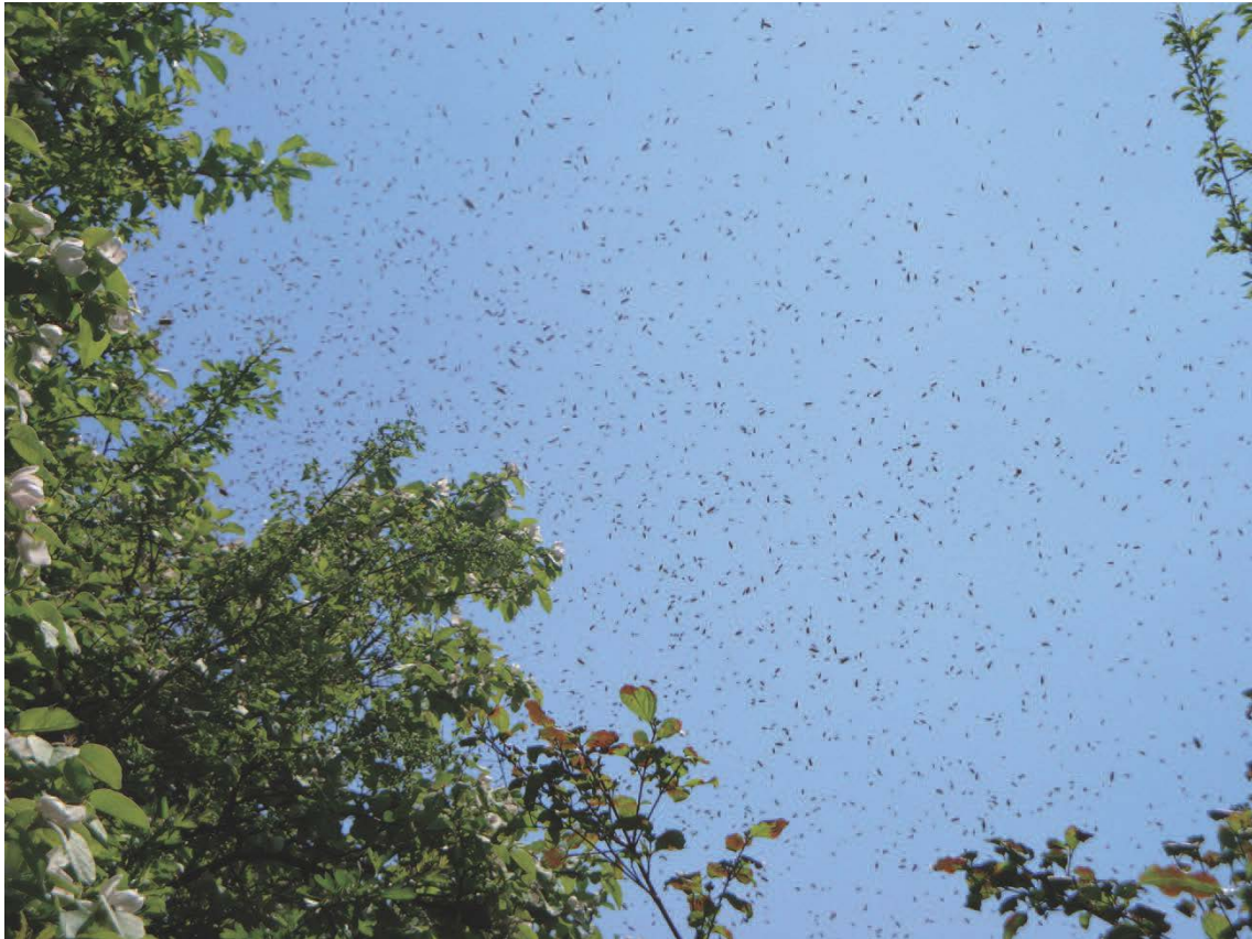
Figure 2 : un essaim peu après qu'il ait quitté sa ruche

Ensuite, la capture d'un essaim permet d'expérimenter de façon immédiate l'approche de la mort. La dynamique du nuage d'abeilles dans l'air, avec son parfum, sa musique et ses mouvements légers est à couper le souffle. Peu de temps après, la représentation tire à sa fin. Rapidement mais sans brouhaha, les abeilles se rassemblent en grappe autour d'une branche, parfois dans un buisson ou autour d'un piquet (voir figure 3). Il suffit de le secouer légèrement pour le faire tomber dans un panier vide ou un seau ou pour le ramasser avec un balai. Il tombe alors lourdement. Les abeilles sont paisibles et ne piquent que rarement. Comparé à une colonie dans sa ruche, un essaim n'a rien d'autre à défendre ; il n'a personne à repousser. La nouvelle colonie naît au moment où les abeilles sont déversées ou pénètrent dans leur nouveau logis (voir figure 4).