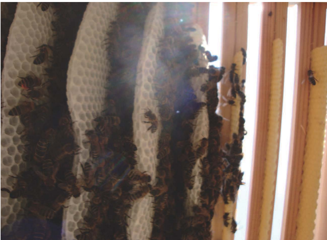
Figure 6 : au fil du temps, les rayons prennent forme à partir de la masse des abeilles