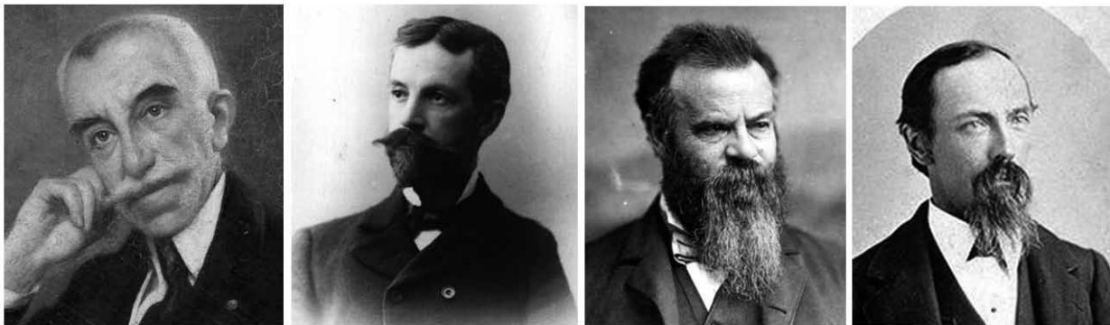
Dans l'ordre de gauche à droite : Pierre Viala (1859-1936), Frank-Lamson Scribner (1851-1938), John-Wesley Powell (1834-1902) et Eugen-Woldemar Hilgard (1833-1916).